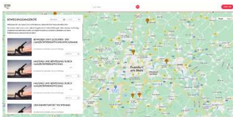
Abbildung 1: Mock-up - Die BewegungsLandkarte in der Desktopansicht

Die BeLa dient somit als zentrale Anlaufstelle für Freizeit-, Breiten-, und Gesundheitssportangebote der Sportvereine. Die eingestellten Angebote können für eine verbesserte Sichtbarkeit bei Angebotseintragung zielgerichtet an die anzusprechenden Personengruppen durch Angabe von Alter, Geschlecht und weiteren Filtern angepasst werden.